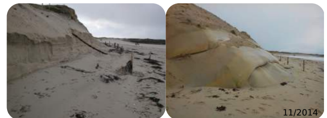
Mise en sécurité du cordon dunaire et atterrissage de câble, structure sur-mesure, France - 01/2014 Client : Groupe Orange

ESPACE PUR - STABIPLAGE 17 route de Loctudy 29120 Pont l'Abbé - FRANCE Tél : +33 (0)2 98 87 08 53 / E-mail : contact@stabiplate.com