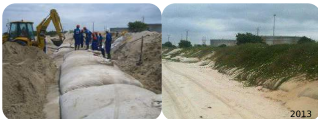
Mise en sécurité du cordon dunaire, ST100, Gabon - 2012 Client : compagnie pétrolière. Expérience présentée à Eurogé 2013