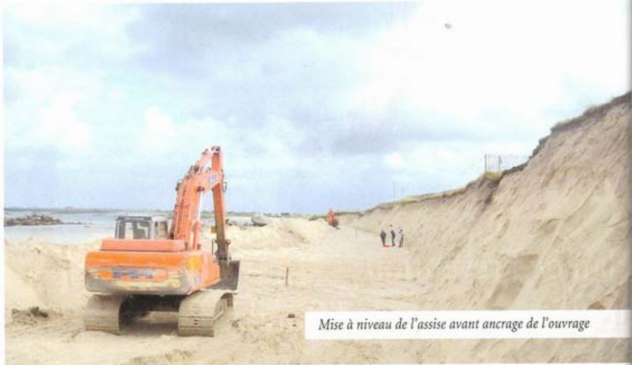
Mise à niveau de l'assise avant ancrage de l'ouvrage