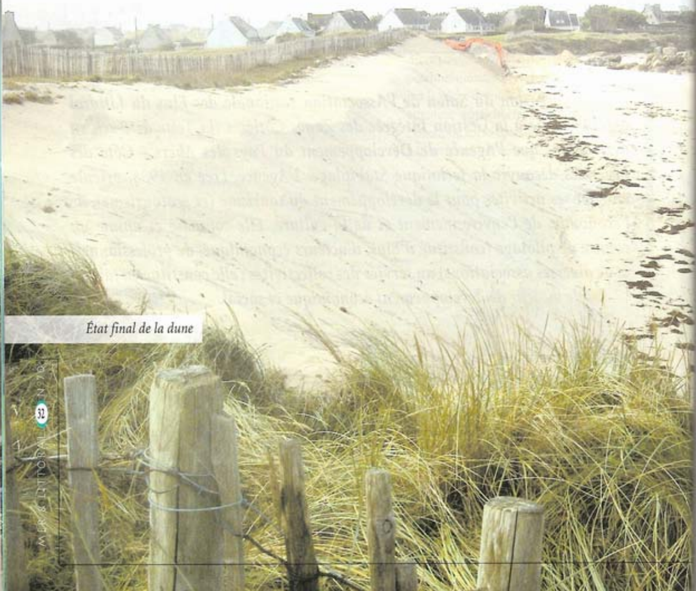
État final de la dune