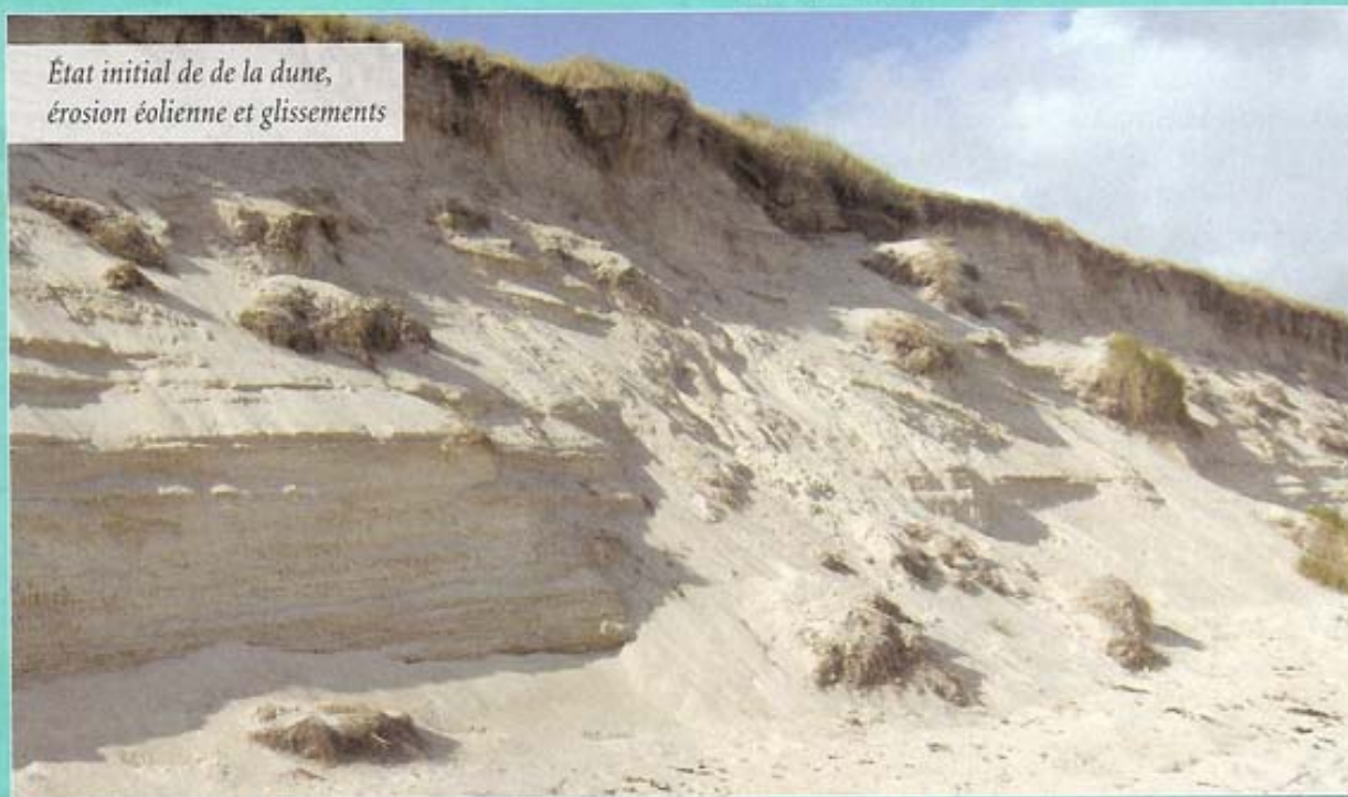
État initial de de la dune, érosion éolienne et glissements