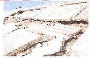
Sous les coups de boutoir des vagues, le perré a fini par céder au niveau du lieu-dit Pleine Mer à Damgan.