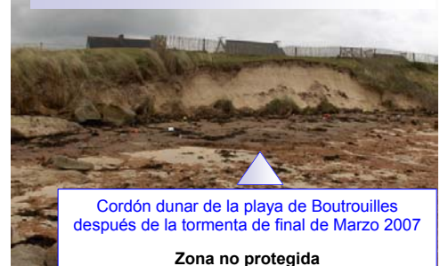
Cordón dunar de la playa de Boutrouilles después de la tormenta de final de Marzo 2007