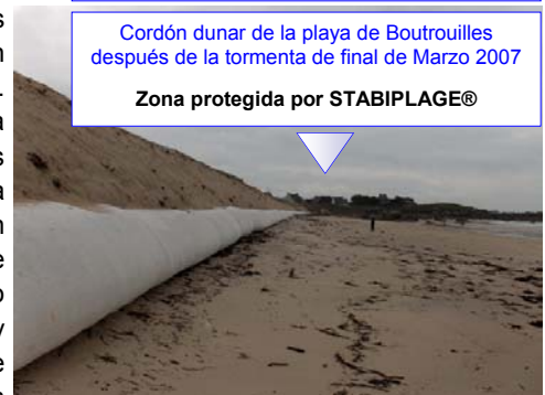
Cordón dunar de la playa de Boutrouilles después de la tormenta de final de Marzo 2007